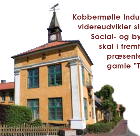
Design: Susanne Thum

Kobbermølle Industrimuseum videreudvikler sig løbende. Social- og byggehistorien skal i fremtiden præsenteres i det gamle "Tårnhus".